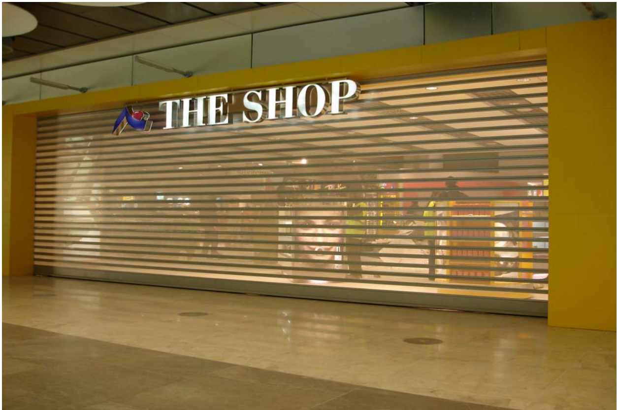
MODELO UP-111 Microperforada (8500mm) T-4 BARAJAS (MADRID)

Cierre enrollable fabricado en lama de aluminio extrusionado de endurecido de aleación 6063T5. Armado con patines de nylon que unido a los burletes de goma disminuyen la sonoridad. Acabado en pintura al horno según carta RAL. Zócalo de 150 mm con goma de estanqueidad. Guías tubulares de 110x85mm con alojamiento para taquilla de accionamiento y embudos de nylon. Eje tubular de acero de 60x3mm y testeros de 3mm. Automatizado mediante motor centro de eje de 600W con electrofreno y accionado mediante y taquilla exterior de desbloqueo en acero inoxidable con pulsador incorporado.